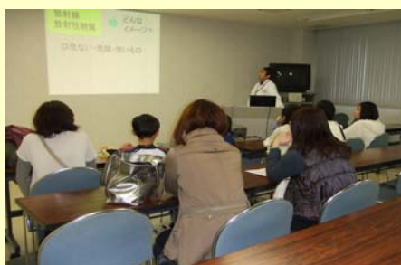
- 真剣な眼差しで講義を聴いていました -

東日本大震災に伴う原発事故により放射性物質が放出されました。事故後の放射性物質の影響を心配される方々のリスク管理のために、当所ではゲルマニウム半導体検出器等を用いた放射性物質検査を行っています。今回は、実際の測定体験を通して、放射性物質について知識を広げてくださいました。