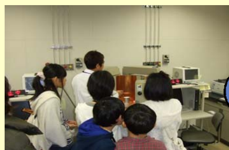
- 装置の仕組みを確認中 -