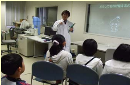
- Kanちゃんと一緒に勉強 -

身の回りにはいろいろなものには、私たちが普段見ることの出来ないミクロの世界が広がっています。電子顕微鏡という装置を使って、電子の目で見える世界を観察しました。